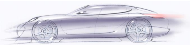
Laboratoarele Departamentului IMF si aplicații specifice de proiectare produs